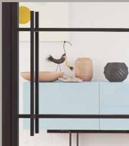
Bargreep (750 mm)