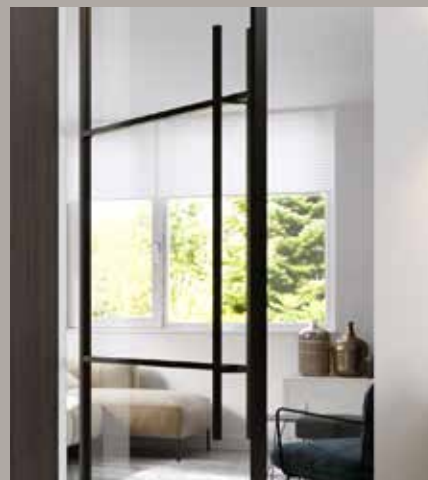
Bargreep (1200 mm)